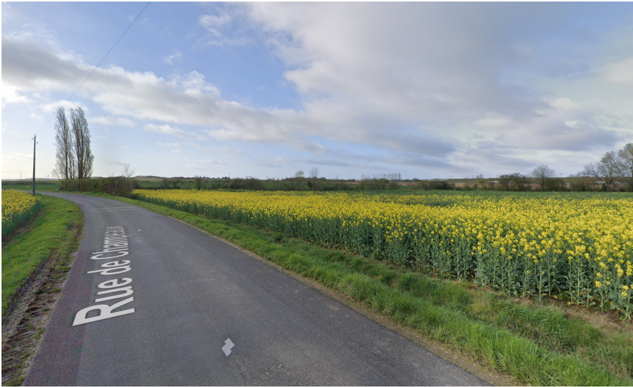
Vue 3 - Depuis la rue de champeaux D57

C:\Users\sophie.guibert\Documents\CRI_APD_ARC_00_ENS_00_BIM_002_0_0_Compilation Impression_sophie.guibert.rvt