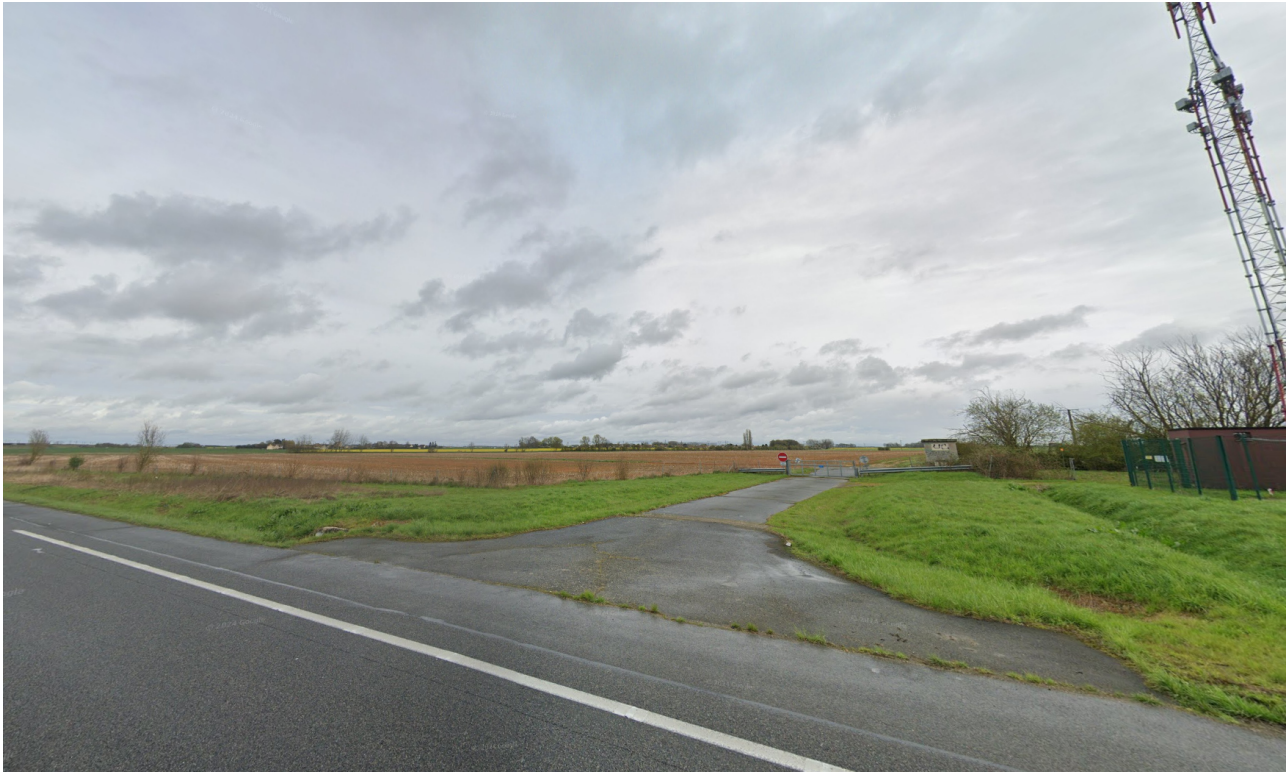
Vue 1 - Depuis l'A5