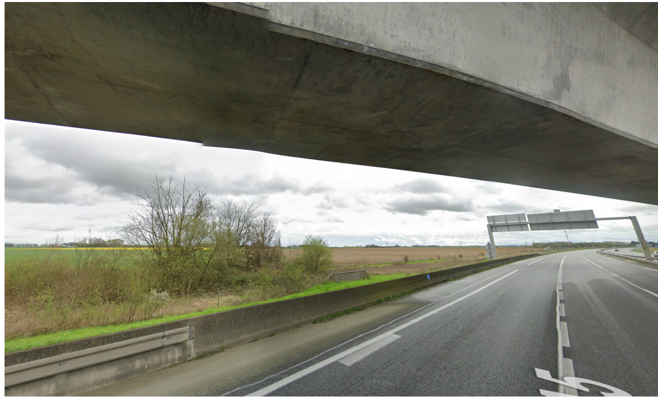
Vue 2 - Depuis l'A5