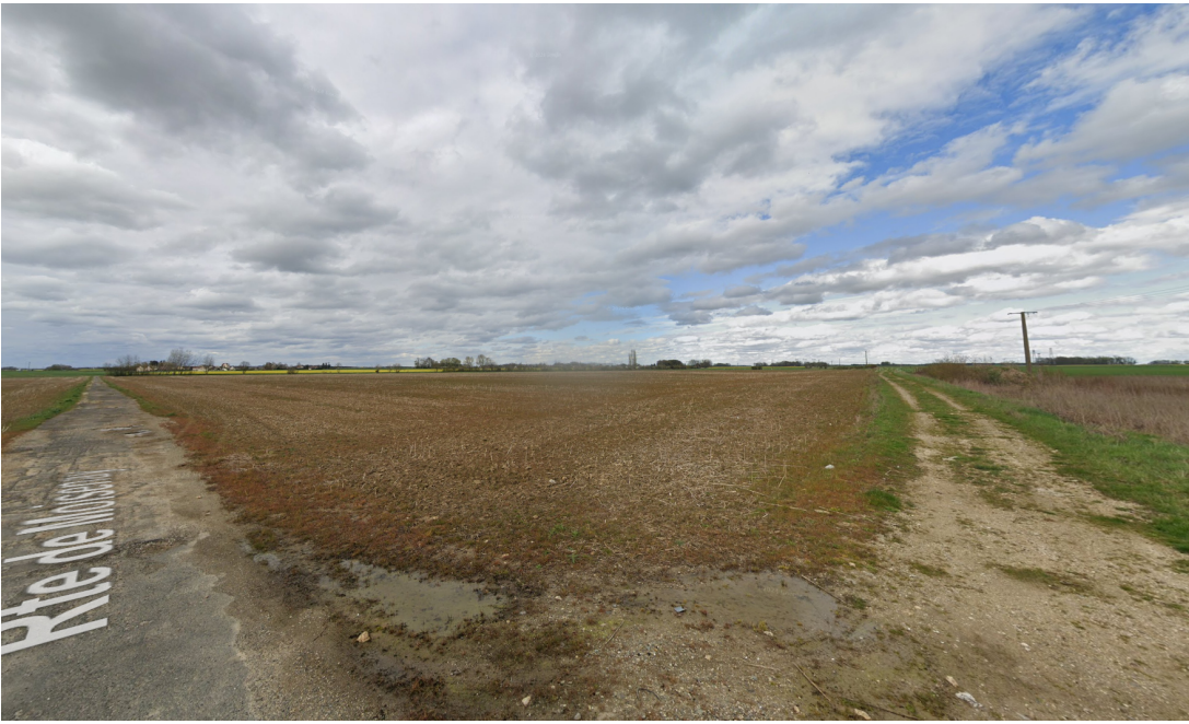
Vue 3 - Depuis la route de moisenay