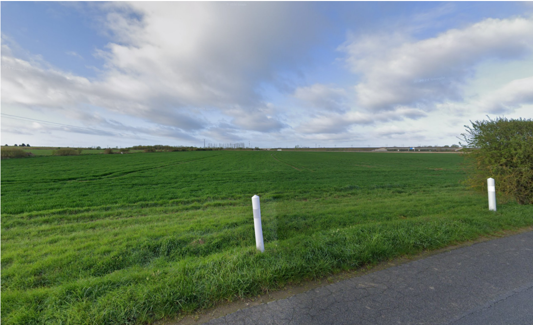
Vue 1 - Depuis la rue de champeaux D57