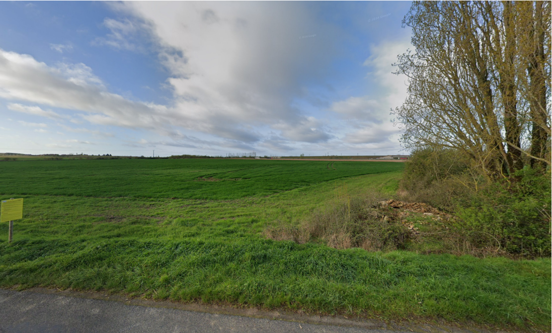
Vue 2 - Depuis la rue de champeaux D57