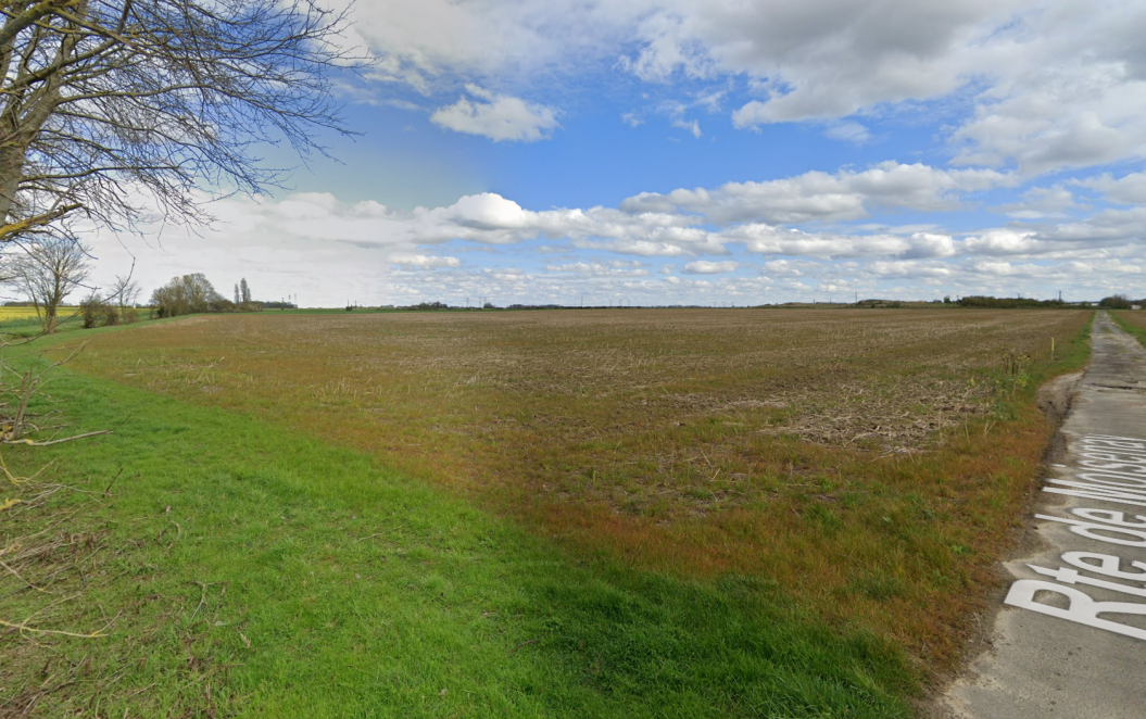
Vue 4 - Depuis la route de moisenay

C:\Users\sofia.guident\Documents\CRP_APD_ARC_00_ENS_00_BIM_002_0_Compilation Impression_sophia.guident.rvt